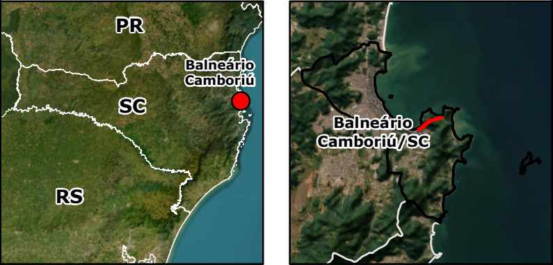
Imagem: Basemap - ArcGIS Áreas de Suscetibilidade - Fonte: CPRM (2015) Divisas Municipais: IBGE (2024)